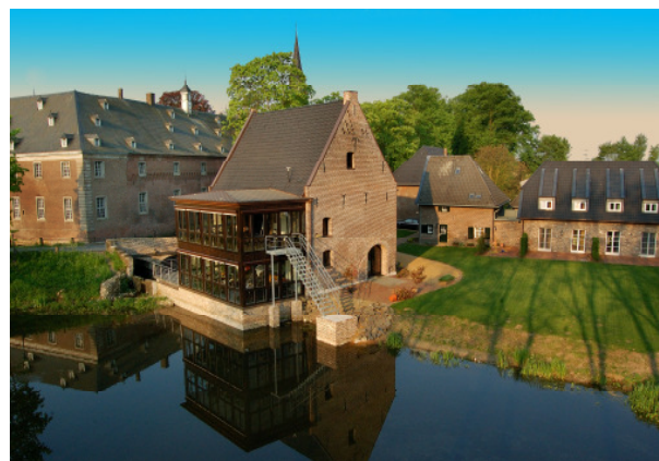
Schloss Wissen - Trainingshaus