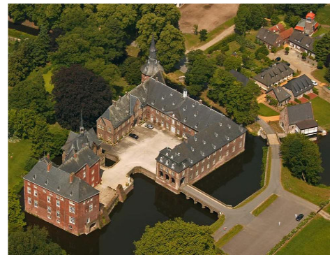
Schloss Wissen - Gesamtansicht

Die Module starten am 1. Tag um 09.30 Uhr und enden am letzten Tag gegen 16.00 Uhr.